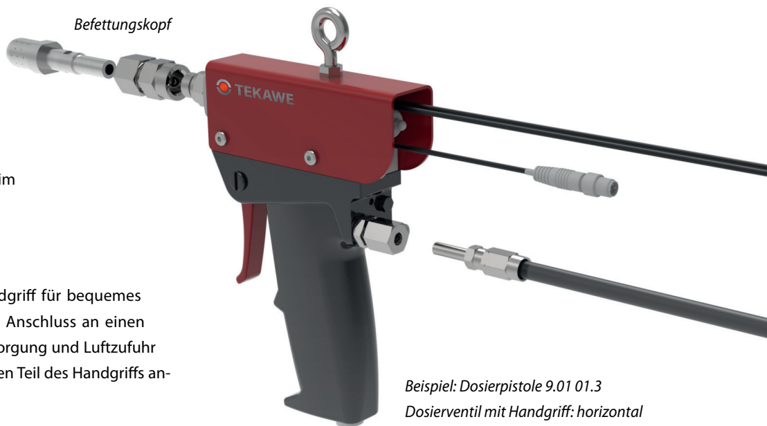
Beispiel: Dosierpistole 9.01 01.3

Der pneumatische Teil des Dosierventils wird über ein im Griff eingebautes pneumatisches 5/2-Wege-Ventil gesteuert: Durch das Betätigen des Abzugs wird die Fettdosierung initialisiert. Der Dosierdruck ist vom Druck im Medium abhängig. Die Luft- und Fettkammer sind voneinander getrennt. Optional mit Sensor erhältlich, um die Prozesssicherheit zu erhöhen.